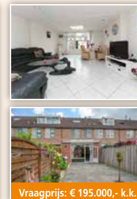
Vraagprijs: € 195.000,- k.k.