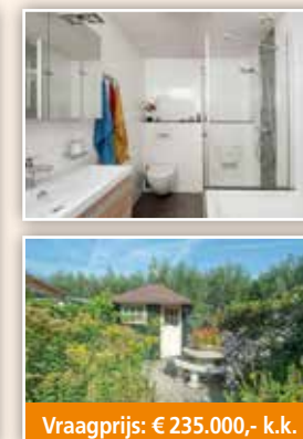
Vraagprijs: € 235.000,- k.k.