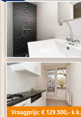
Vraagprijs: € 129.500,- k.k.