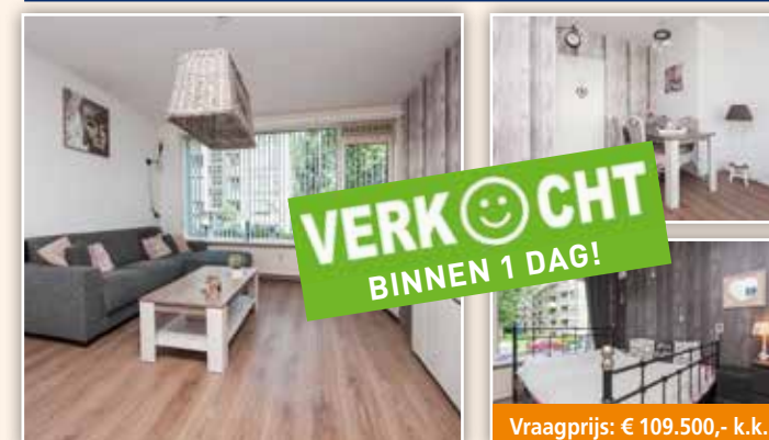
Schalkeroord 26, Rotterdam-IJsselmonde

Woonoppervlakte: 110 m 2 | Perceel: 150 m 2