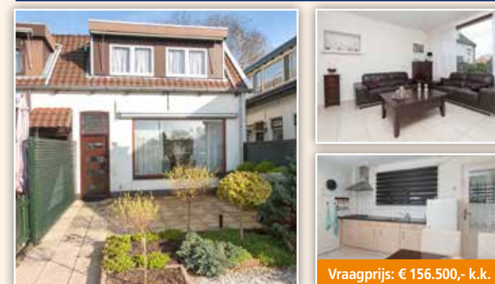
Sportlaan 46, Rotterdam-IJsselmonde

Leuke rustig gelegen woning in de wijk Sportdorp met grote voortuin. De woning is goed onderhouden en voorzien van een moderne badkamer en een nette keuken en heeft 4 slaapkamers op de 1e verdieping (2 grotere en 2 kleine kamers). De begane grond is voorzien van een plavuizen vloer met vloerverwarming en de woning is dit jaar voorzien van een nieuwe Cv-combiketel (Nefit 2017).