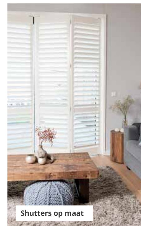
Shutters op maat