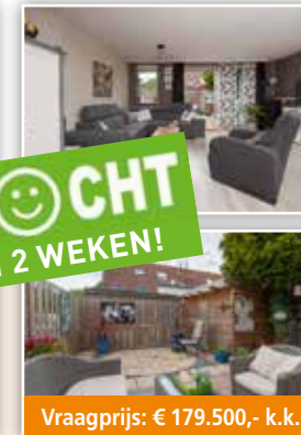
Vraagprijs: € 179.500,- k.k.