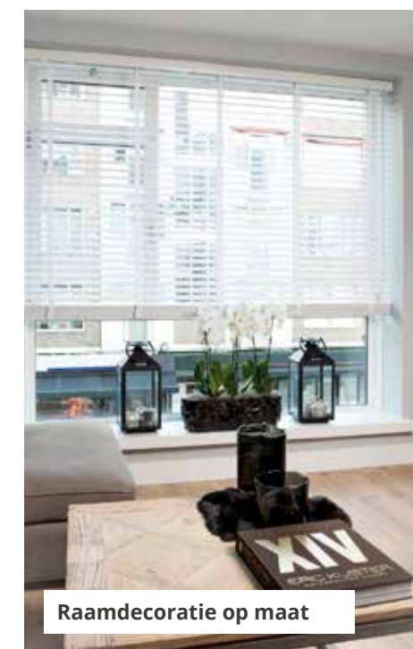
Raamdecoratie op maat

BESTEL OP WWW.INHUISPLAZA.NL OF KOM LANGS IN ONZE SHOWROOMS IN BARENDRECHT, NAARDEN OF AARTSELAAR