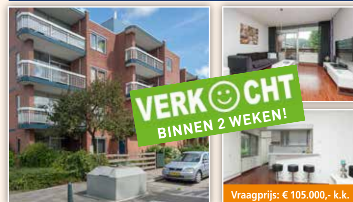
Tubantenoord 7, Rotterdam-IJsselmonde

Ruim 2 kamer appartement op de 1e verdieping op EIGEN GROND! De woning is intern keurig afgewerkt en heeft een ruim en zonnig balkon aan de voorzijde (Zuiden). De woning is geheel van deze tijd. Nette keuken met een grote inloop voorraadmast. Vanuit de keuken ook toegang tot het balkon aan de achterzijde. Geheel aluminium kozijnen met dubbel glas. Centrale verwarming d.m.v. blokverwarming.