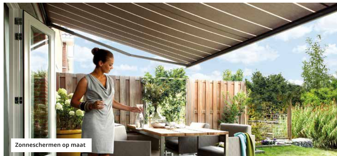
Zonneschermen op maat

BESTEL OP WWW.INHUISPLAZA.NL OF KOM LANGS IN EEN VAN ONZE SHOWROOMS