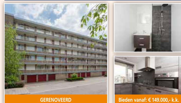
Schuilingsoord 165, Rotterdam-IJsselmonde

Woonoppervlakte: 110 m 2 | Perceel: 173 m 2