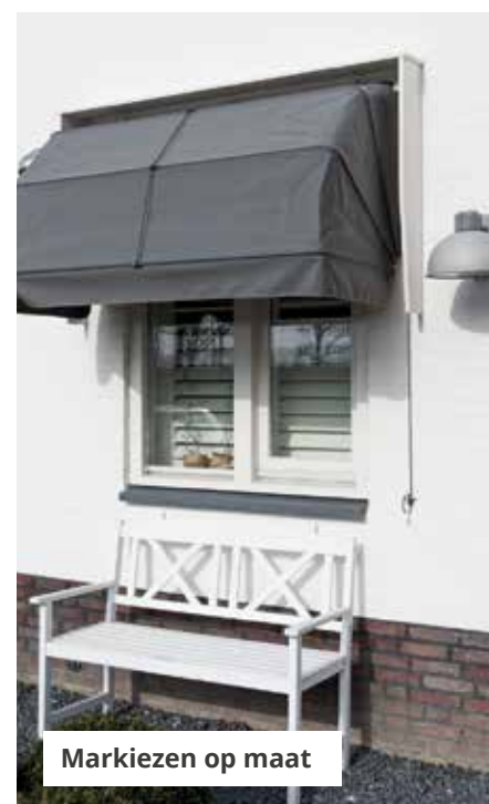
Markiezen op maat

BESTEL OP WWW.INHUISPLAZA.NL OF KOM LANGS IN EEN VAN ONZE SHOWROOMS