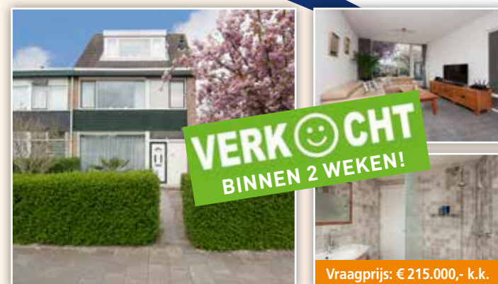
Rhederoord 10, Rotterdam-IJsselmonde