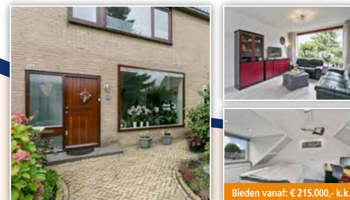
Riet 7, Barendrecht

Goed onderhouden en rustig gelegen 5-kamer eengezinswoning op 150 m 2 eigen grond in de wijk Paddewei. De woning is geheel voorzien van hardhouten kozijnen met dubbel glas en de woonkamer heeft een schuifpui naar de achtertuin. Cv d.m.v. moderne Cv-combiketel (2015). Ligging aan een voetpad in een kindvriendelijke straat met diverse speelgelegenheden in de buurt.