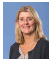
J.M.M. Stolk margostolk@ echtvoorbarendrecht.nl