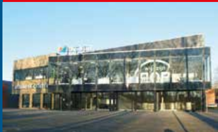
Alblasserdam, Kelvinring 54