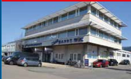
Zwijndrecht, H.A. Lorentzstraat 4