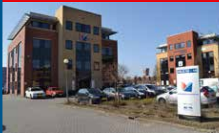
Barendrecht, Oslo 10-16