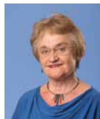
T. Klos-de Vries t.klosdevries@ gmail.com