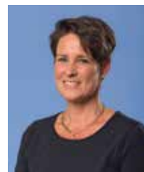
M. Mes-le Feber mirandames@ echtvoorbarendrecht.nl