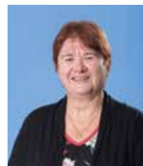
Gekke Figge Raadsgriffier

Op elke dinsdag zijn er raads- en/of commissievergaderingen, behalve tijdens schoolvakanties. De commissie Planning & Control vergadert doorgaans op maandagavond. De vergaderingen worden gepubliceerd in de gemeentekrant 'Blik op Barendrecht' en staan ook op de website, https://barendrecht.raadsinformatie.nl . De gemeenteraad kijkt of het college zijn werk goed doet. De raad heeft daar een aantal middelen voor, zoals het recht om vragen te stellen, het recht om voorstellen van het college te wijzigen (amendement) of het recht om een onderzoek in te stellen. Onderzoeken worden uitgevoerd door een speciale commissie van onderzoek of de Rekenkamer.